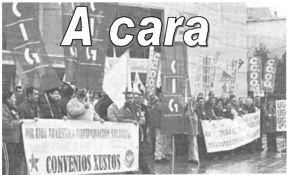
Los funcionarios de la Xunta reclamaron mayor atención en los presupuestos para el próximo año

UGT, CC.OO e CSI-CSIF Rexeitan en GALIZA o que acordaron coa Administración na Mesa Xeral da Función Pública.